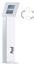
Présentoir multimédia iPad sur pied 19 cm - Oh-PAD 750,00 €